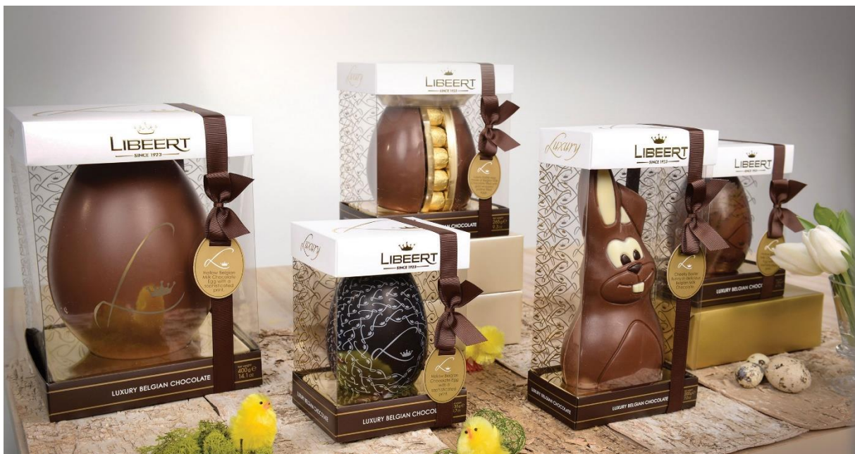
Sinds 1923 maakt Libeert premium Belgische chocolade. Vandaag produceren ze meer dan 5.000 ton chocolade per jaar.

In eerste instantie was Libeert niet van plan om de infrastructuur zo grondig aan te pakken. “We wilden wel alles vernieuwen en virtualiseren, maar het disaster recovery-plan dat Savaco voorstelde, hadden we niet meteen in gedachten. Dankzij Savaco hebben we het belang daarvan voor ons productiebedrijf ingezien en hebben we gekozen voor een doorgedreven vernieuwing. Het kostenplaatje ligt iets hoger, maar als de productie stilvalt dan is de financiële impact natuurlijk nog veel groter. Dergelijke risico's kan je je als bedrijf niet meer permitteren.”